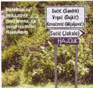
Putočani za neka nova prezimena, sa sveprisutnim Hajdukom