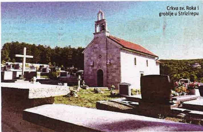
Crkva sv. Roka i groblje u Strizirepu