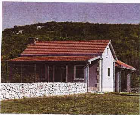
Ovakve kuće i imanja Strizirepu daju dodatnu vrijednost