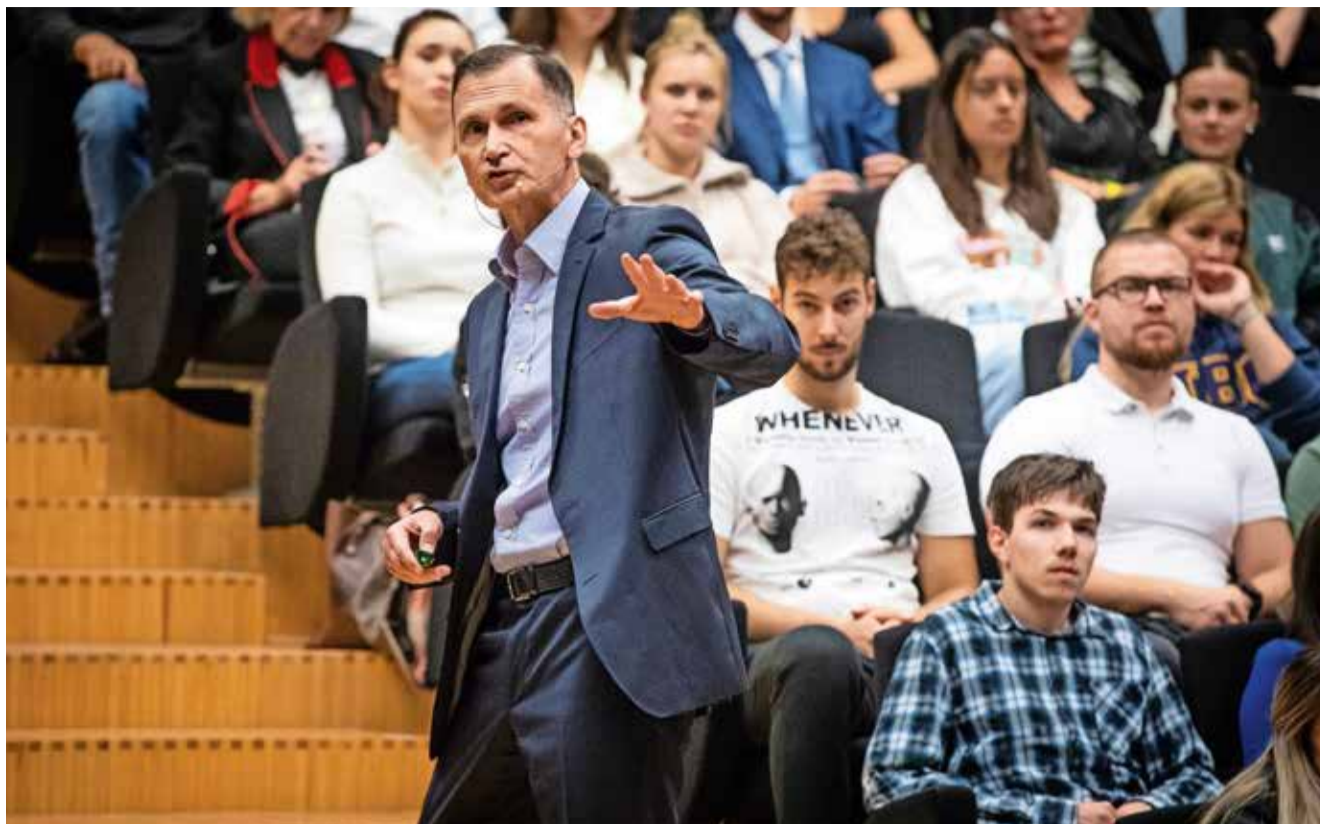
'Jedan od mojih najvećih snova jest dijeliti znanje s mladim ljudima'