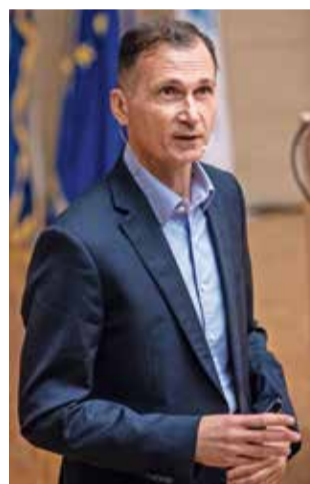
'Važno je spomenuti da izvrsnost nije pitanje slučajnosti, već odabira'