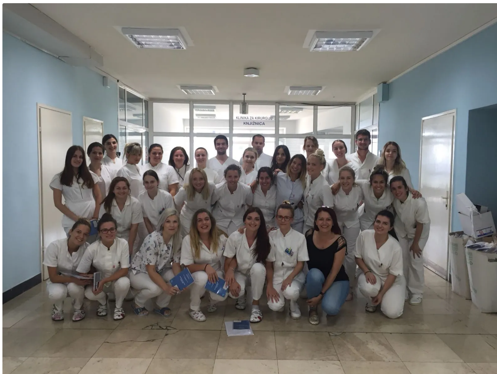
Istražili smo čime se sve možete baviti ako vas zanima rad u zdravstvenom sektoru

Studiji u zdravstvu privlače mnoge maturante. No jeste li upoznati sa širinom mogućnosti koje imate za studij i posao unutar tog sektora? U suradnji sa Sveučilišnim odjelom zdravstvenih studija Sveučilišta u Splitu istražili smo koje sve karijere, osim one liječničke, možete graditi u zdravstvu. Doznali smo i kako će vam izgledati studij, ali i neke prednosti studiranja u Splitu.