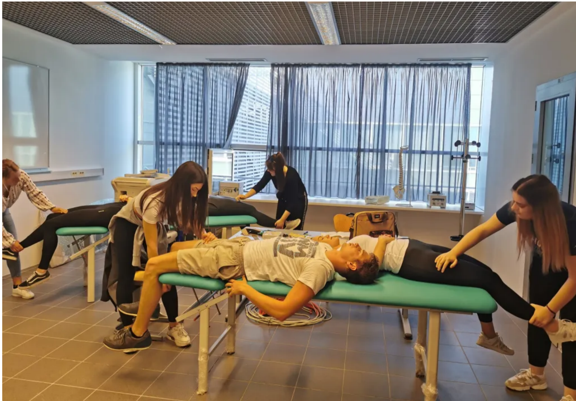
Studij fizioterapije naučit će vas sve o medicinskoj rehabilitaciji