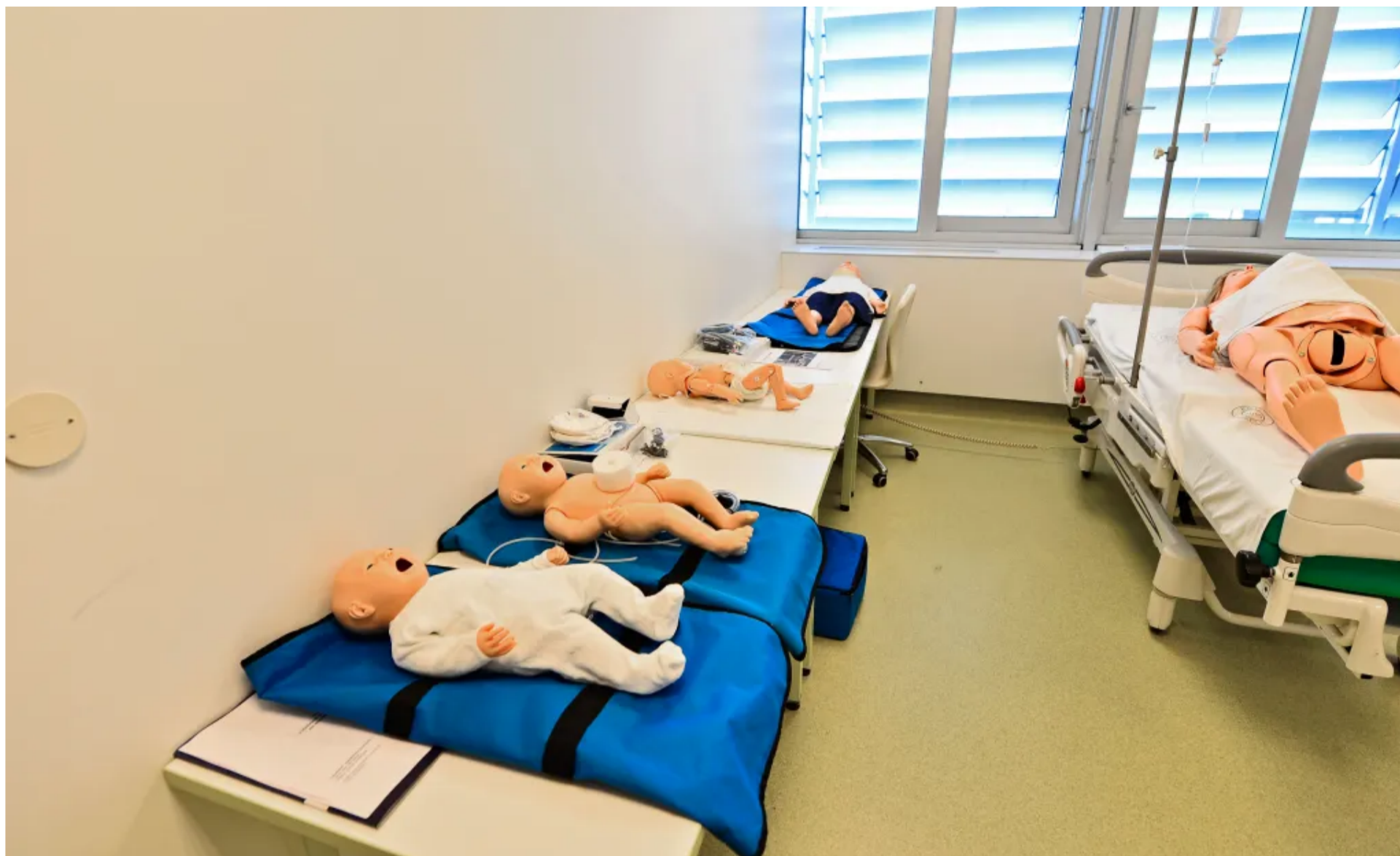
Studij primaljstva znači da ćete se baviti cjelokupnim zdravljem žena, majki i djece