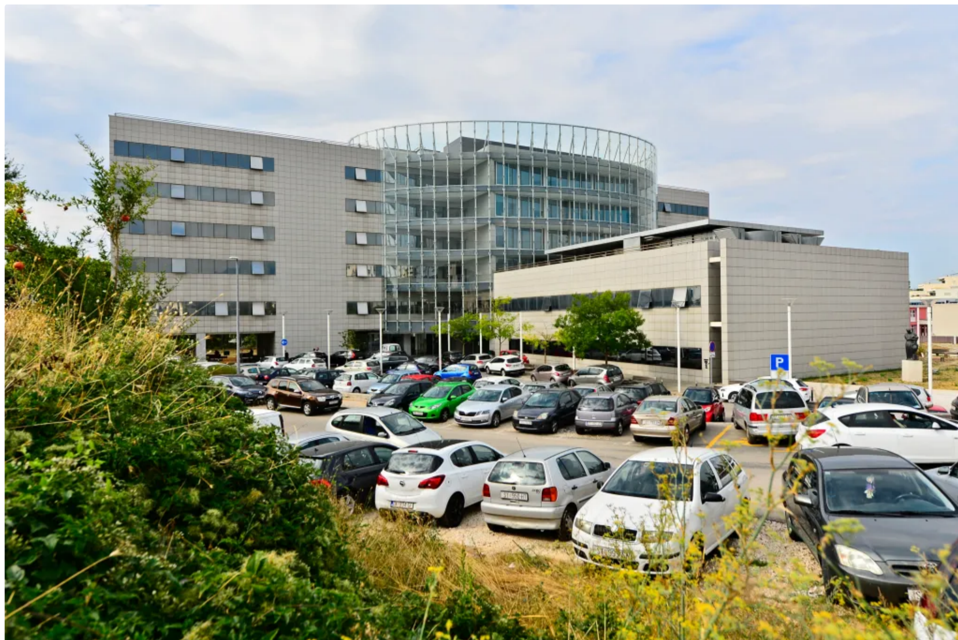
Sveučilišni odjel zdravstvenih studija Sveučilišta u Splitu