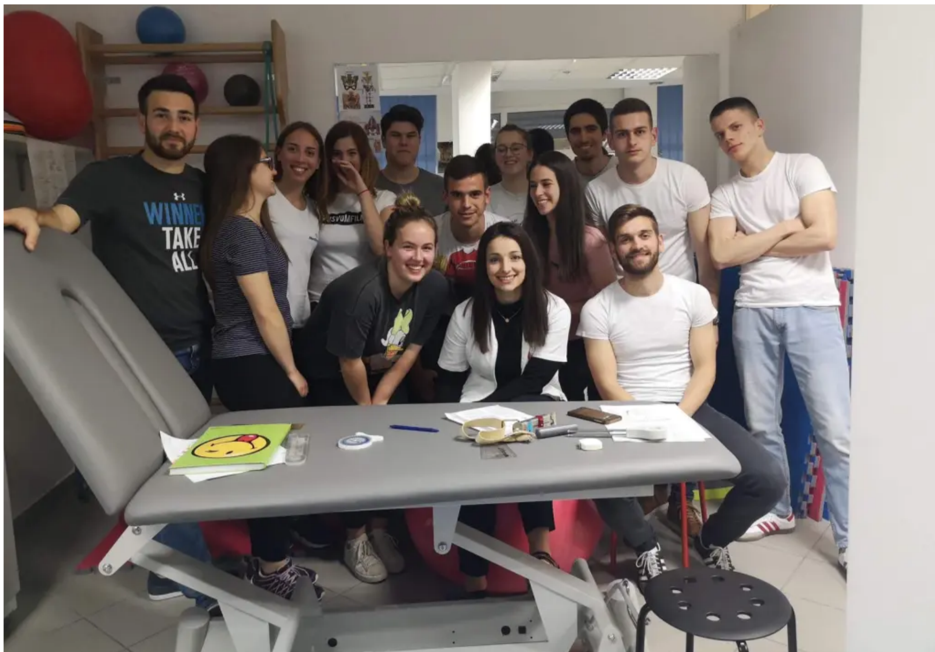
Studenti SOZS-a