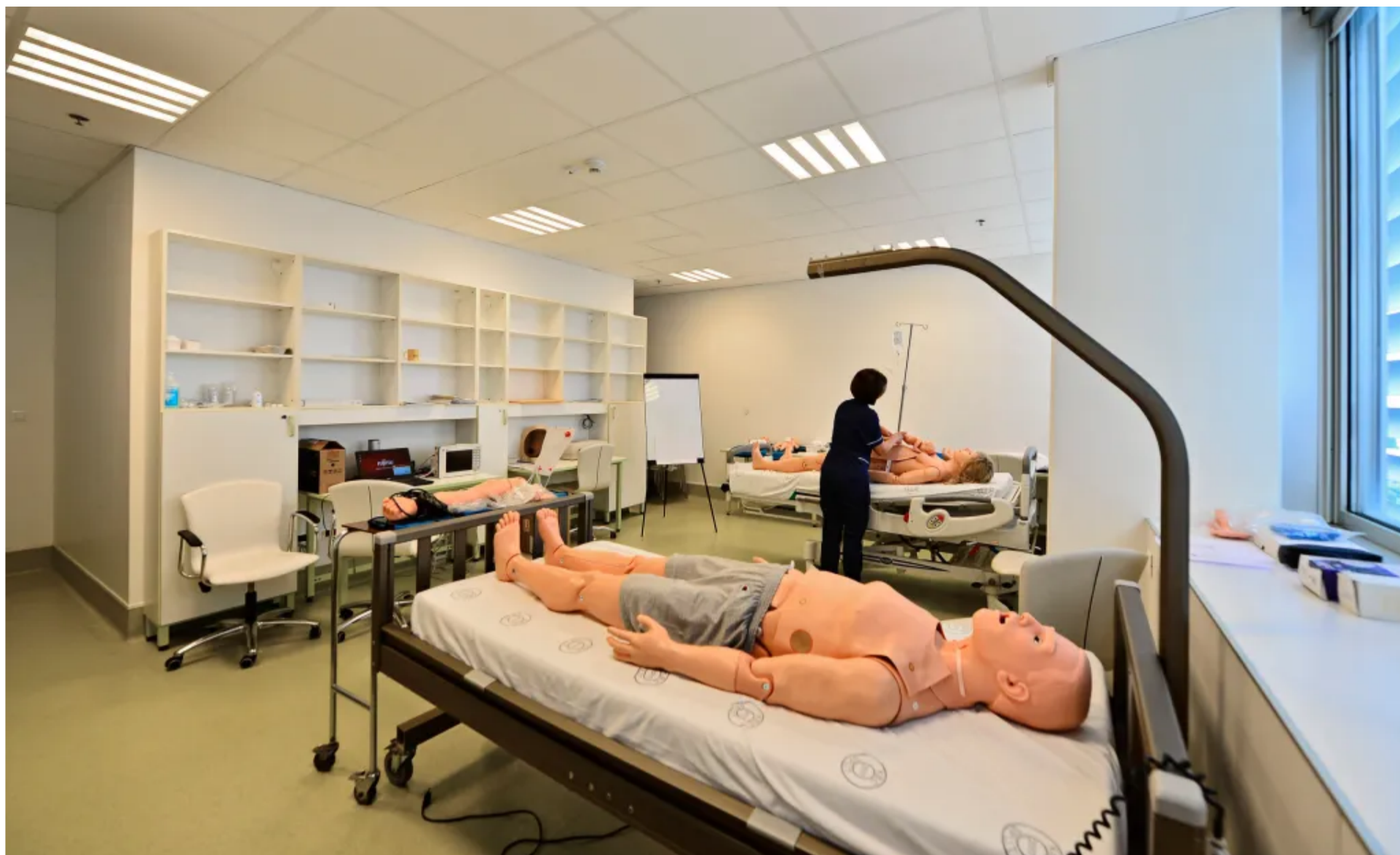
Studij sestrinstva upoznat će vas sa svom širinom medicine, i to kroz teoriju i praksu podjednako