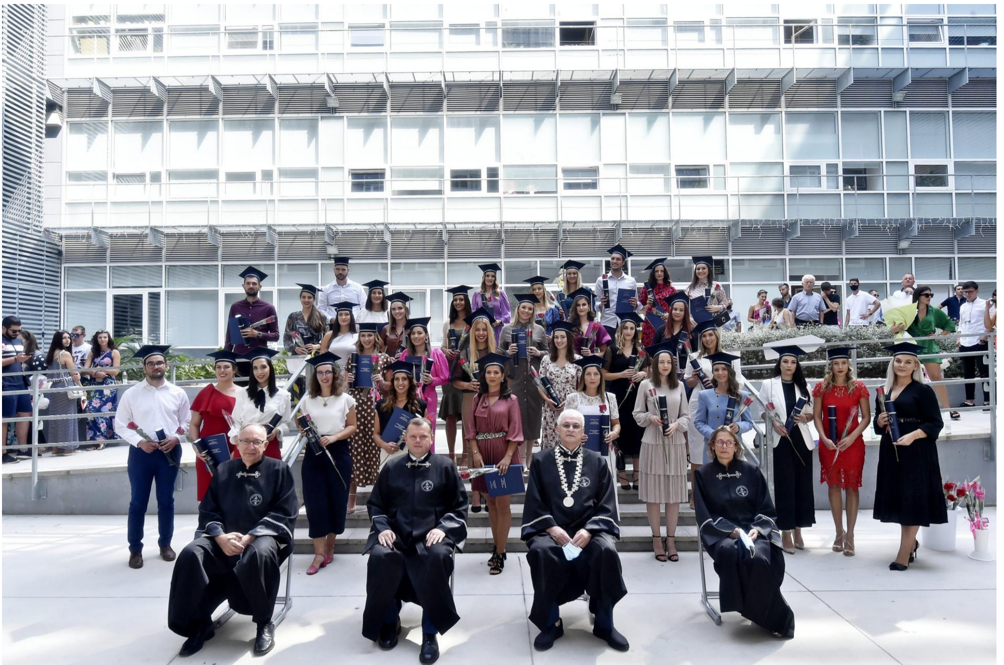
Svecana promocija diplomiranih studenata Sveučilišnog odjela zdravstvenih studija održala se na platou ispred zgrade Tri fakulteta.