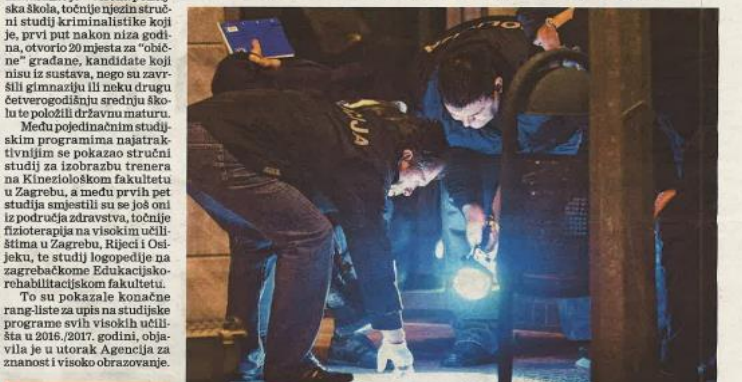
Studij kriminalistike je nakon dugo vremena otvoren za "civilne".

Začuduje toliki interes maturanata, s obzirom na to da im nakon završene kriminalistike posao nipošto nije siguran. U Sindikatu policije ovu navalu tumače utjecajem CSI serija, zbog kojih mladi posao krim-inspektora smatraju uzbudljivim i zanimljivim