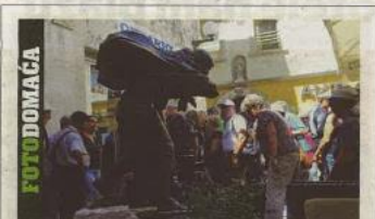
Turisti u Rijeci ispred spomenika grobničkoj miješarici, posvećenom ženama koje su donosile mlijeko u grad.